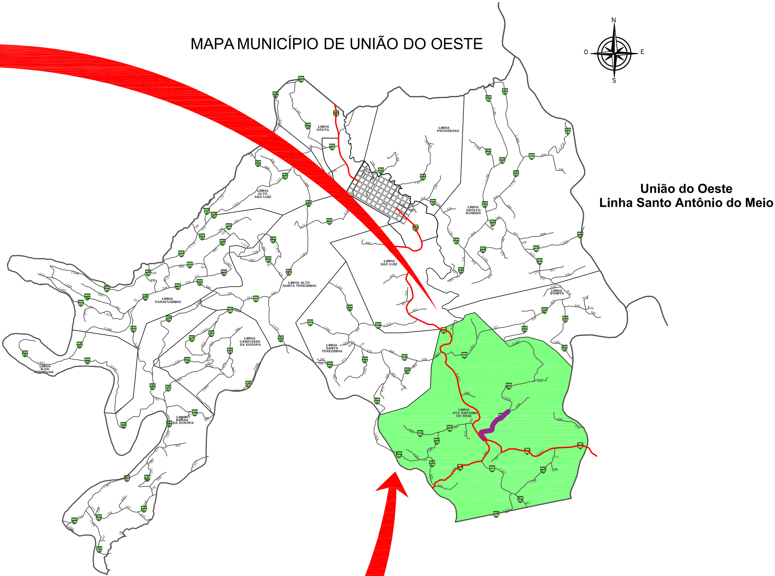
União do Oeste Linha Santo Antônio do Meio