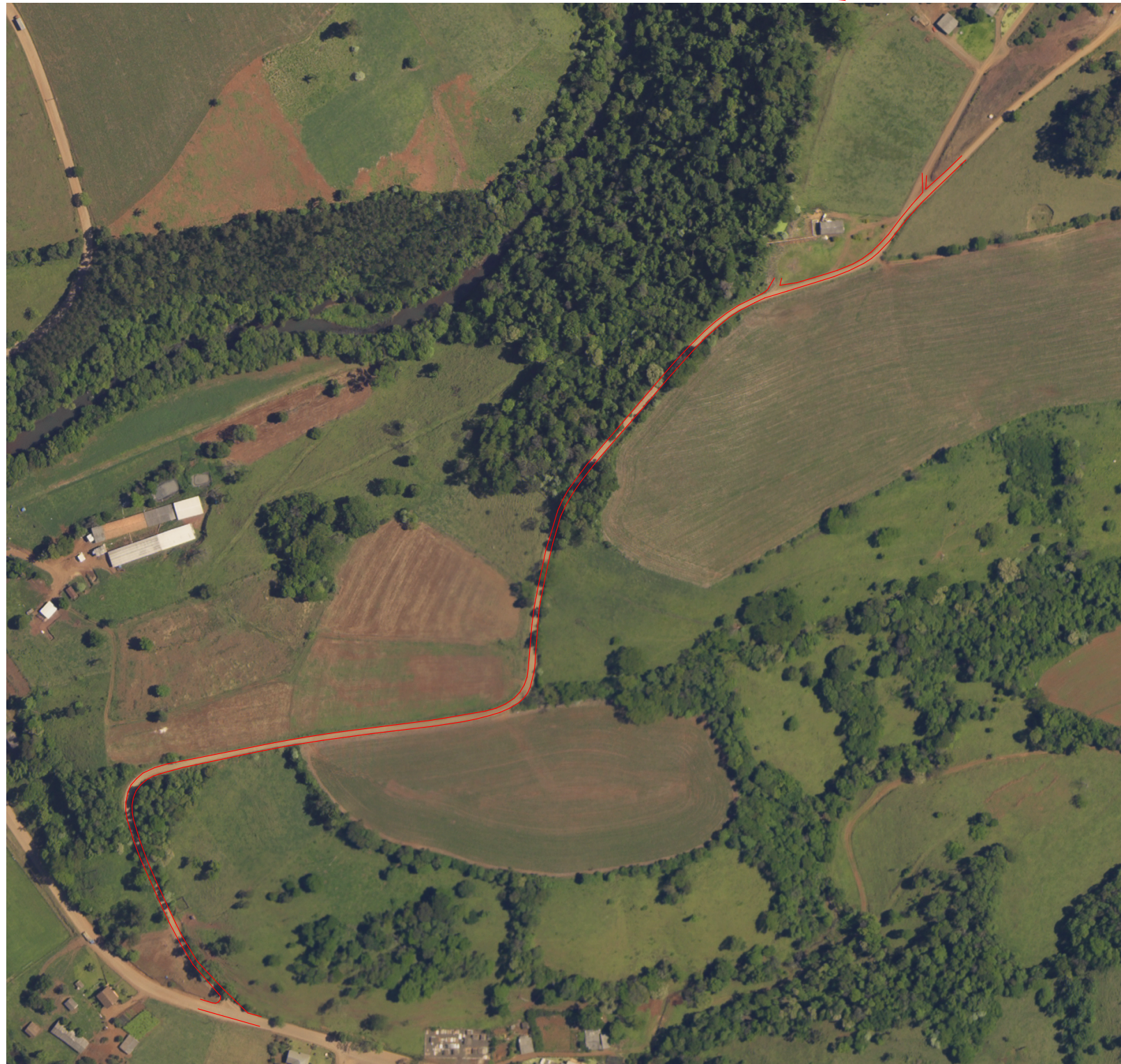
LOCAÇÃO ESTRADA EM CALÇAMENTO LINHA SANTO ANTÔNIO DO MEIO