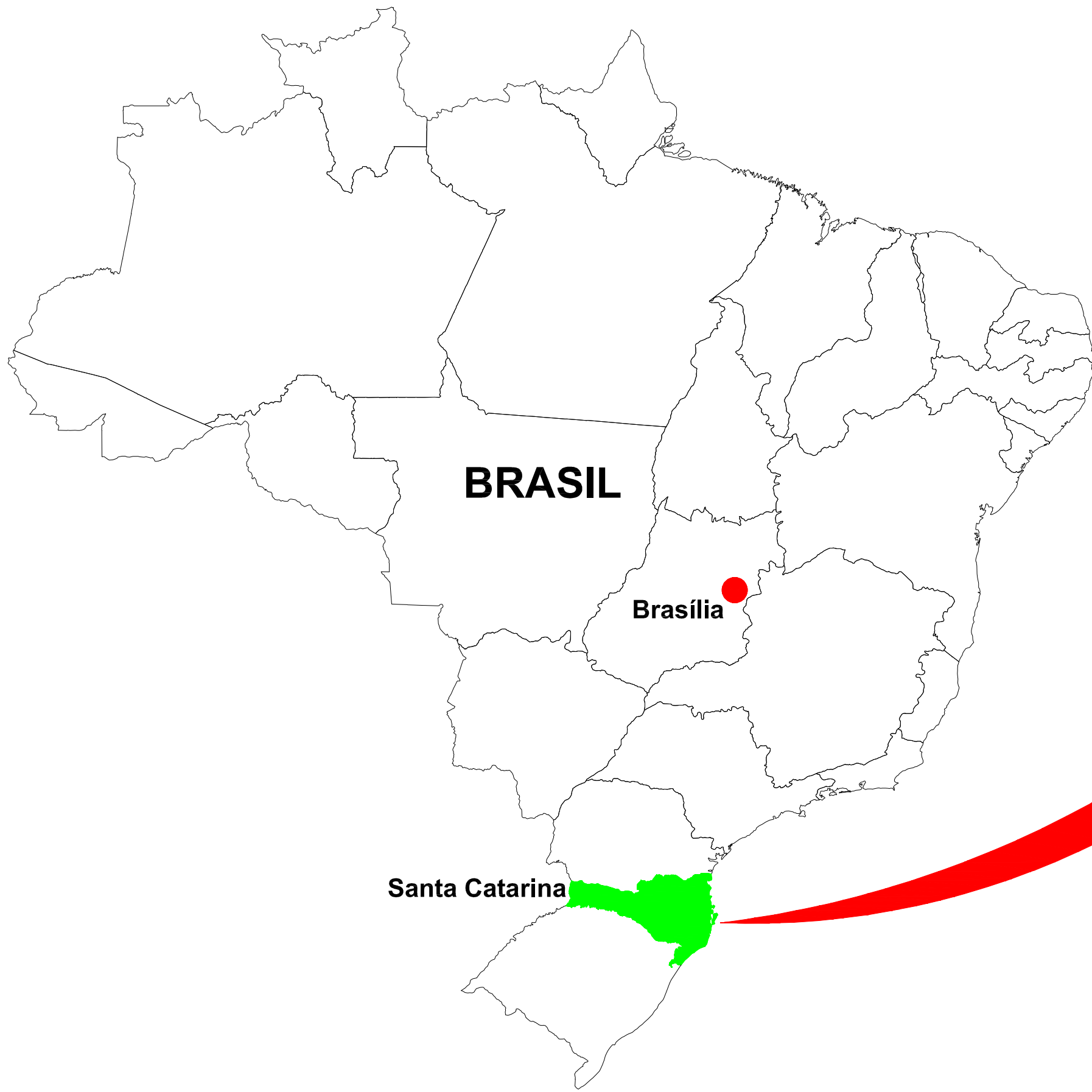
BRASIL Brasília Santa Catarina