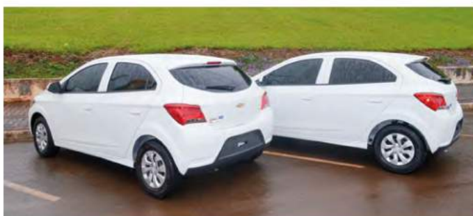
Dois (2) veículos, modelo Onix 1.0 da Chevrolet. Para trabalhos na Saúde e na Educação. Investimentos: R$ 96.200,00