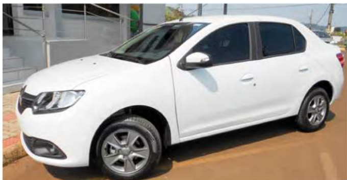
Um veículo Logan 1.6 para a saúde Investidos R$ 54.500,00