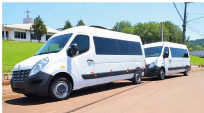
Duas (2) Vans para trabalhos na Saúde e na Educação. Cada veículo tem capacidade para transportar 16 pessoas Investimento de R$ 297.800,00