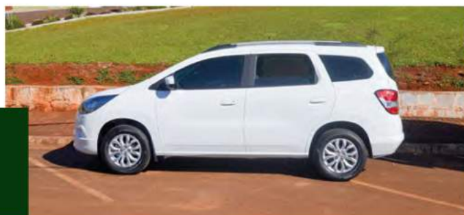
Um (1) novo veículo modelo SPIN 1.8 da Chevrolet, para trabalhos na Saúde. Investimentos: R$ 79.950,00