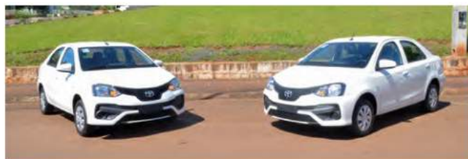
Dois veículos Toyota Etios SD X, motor 1.5/4CC de 107 CV. Para trabalhos na Assistência Social. Investimentos na ordem de R$ 95.200,00